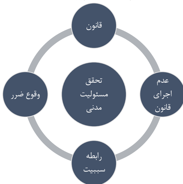
شکل ۱. چهارچوب مفهومی مطالعه

مختلف است. این تحلیل یک روش ساده و انعطاف پذیر و در عین حال قوی است و برای هر نوع تحقیقی قابل استفاده است. ۲۵ به داده‌ها معنای شفاف، غنی و دقیق می‌دهد که می‌تواند به جمع بندی نتایج کمک کند. ۲۶