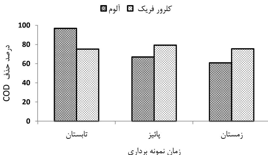
شکل ۱: راندمان حذف COD از آب سطحی سرخه حصار در شرایط بهینه عملکرد آلوم و کلرور فریک

شکل ۱، راندمان حذف COD از آب سطحی سرخه حصار را در شرایط بهینه عملکرد آلوم و کلرور فریک در سه فصل نمونه برداری تابستان، پائیز و زمستان نشان می دهد. راندمان حذف COD در شرایط بهینه عملکرد آلوم (۴۵ mg/L)