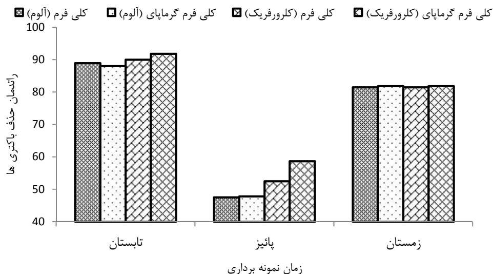
شکل ۴: راندمان حذف کلی فرم کل و گرمپای در آب سطحی صالح آباد در شرایط بهینه عملکرد آلوم و کلرور فریک

کدورت در ابتدا با افزایش دوز آلوم از ۱۰ تا ۵۰ mg/L کاهش، اما با افزایش دوز آلوم به ۶۰ mg/L مقدار آن افزایش پیدا نمود. بررسی کاهش کدورت نشان داد که شیب این کاهش در ابتدا (دوز ۱۰ mg/L) اما با افزایش دوز آلوم تا ۲۰ mg/L کاهش قابل ملاحظه‌ای در میزان کدورت حاصل نشد. با افزایش دوز از ۲۰ تا ۵۰ mg/L، شیب کاهش دوباره افزایش پیدا کرده و بنابراین مقدار ۴۵ mg/L بعنوان دوز بهینه انتخاب گردید. در خصوص آب سطحی صالح آباد، آلوم در غلظت‌های ۵ تا ۵۰ mg/L مورد بررسی قرار گرفته و در نهایت غلظت ۲۸ mg/L بعنوان دوز بهینه انتخاب گردید.