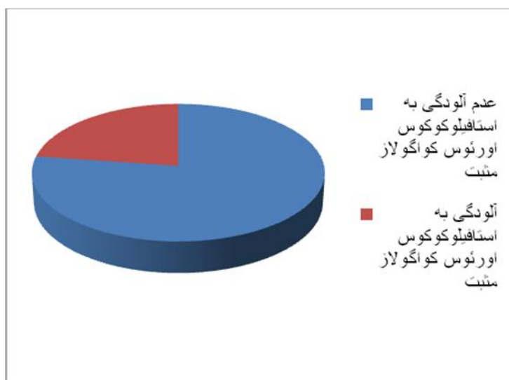
نمودار ۱: میزان آلودگی پنیر سنتی ليقوان عرضه شده در فروشگاه‌های تهران به استافیلوکوکوس اورئوس کواگولاز مثبت

بر این اساس حد مجاز استافیلوکوکوس اورئوس در یک گرم پنیر رسیده در آب نمک حداکثر ۱۰۰ باکتری می‌باشد و