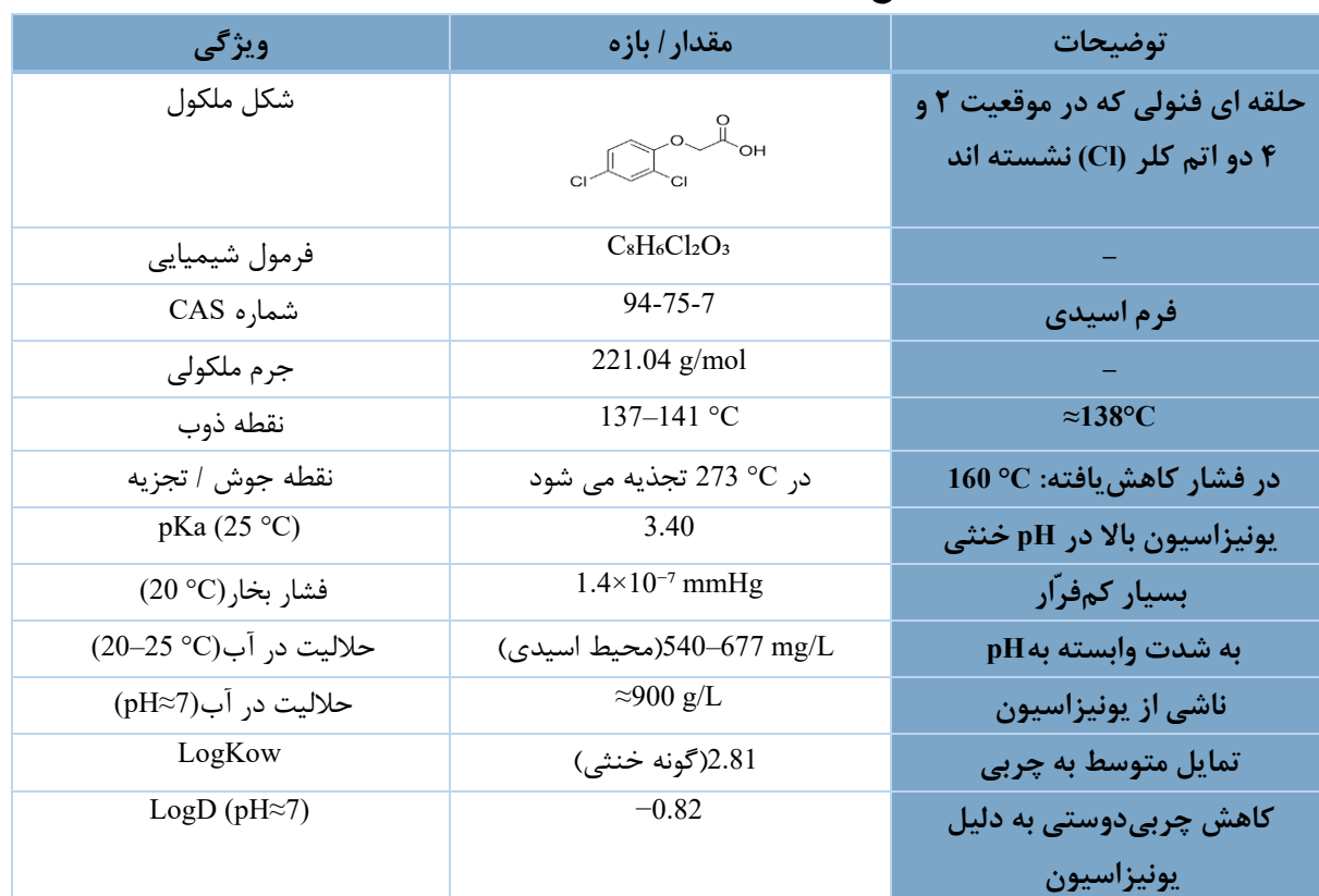
جدول ۱. انواع ویژگی‌های فیزیکوشیمیایی علفکش ۴ و ۲-دی ۲۶، ۴۷-۴۴