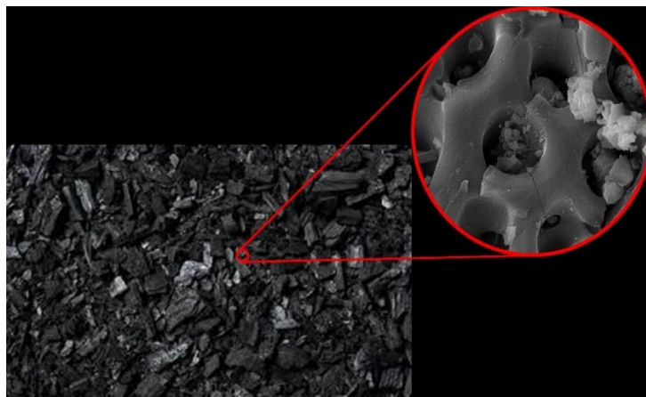
شکل ۳. نمای ماکروسکوپی و تصویر SEM بایوچار ۸۵، ۸۶

از منظر زیست محیطی، بایوچار به عنوان یک جاذب سبز و پایدار مورد توجه قرار گرفته است. استفاده از ضایعات کشاورزی و منابع تجدیدپذیر برای تولید بایوچار نه تنها هزینه تولید را کاهش می‌دهد، بلکه موجب کاهش مشکلات ناشی از مدیریت پسماند و انتشار گازهای گلخانه‌ای نیز می‌شود. همچنین، پایداری بالای بایوچار در محیط باعث می‌شود که این ماده نه تنها در تصفیه آب و پساب، بلکه در