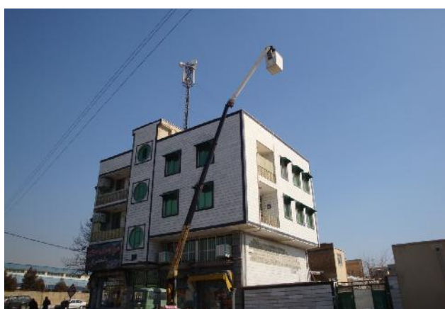
شکل ۱: نحوه استقرار جرثقیل بالابر

در شکل ۲ آنتن‌های زرد رنگ، نشاندهنده آنتن‌های ایرانسل و آنتن‌های سبز رنگ، نشاندهنده آنتن‌های همراه اول می‌باشند.