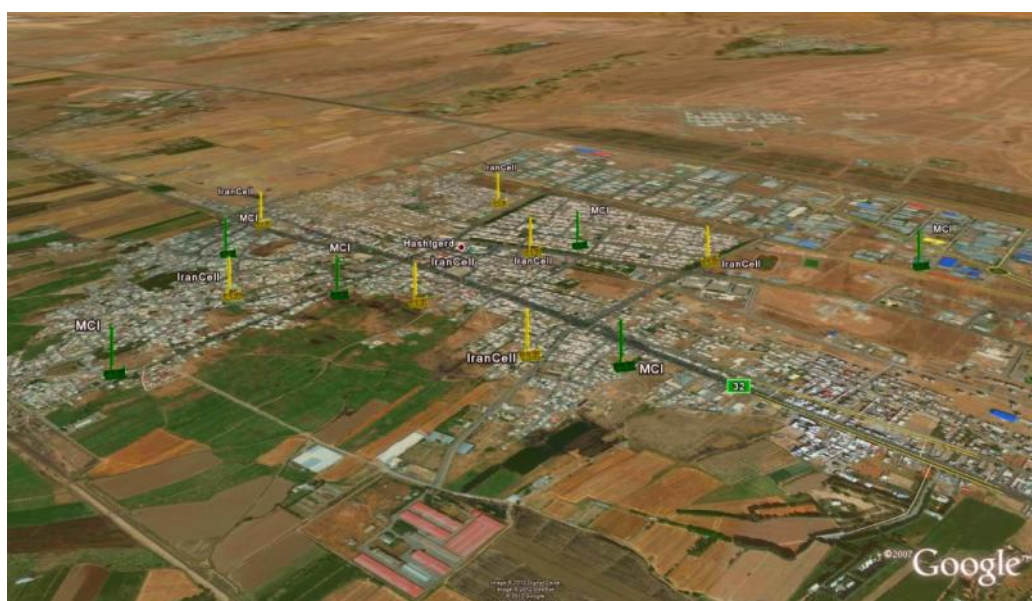
شکل ۲: تصویر وضعیت استقرار آنتن‌های BTS شهر هشتگرد بر روی نقشه

لازم به توضیح است که میدان دور آنتن (Reff) به طور تقریبی از رابطه زیر بدست می‌آید که در آن D = طولانی‌ترین بعد خطی آنتن = (1/8) متر) و y = (طول موج است = 33 ) (y / (Reff) = 2D^2 ) بنا بر این طبق فرمول (۱) شروع میدان دور آنتن به طور تقریبی در فاصله ۲۰ متر است. سنجش چگالی