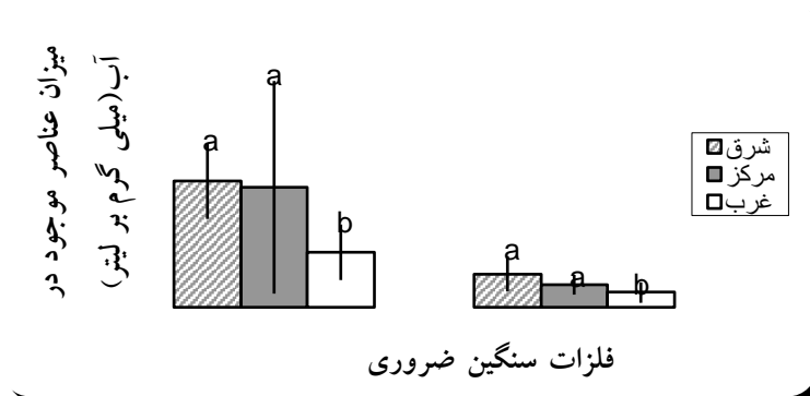
نمودار ۱: نمودارهای متوسط میزان فلزات سنگین در نمونه‌های آب در سه بخش تالاب انزلی