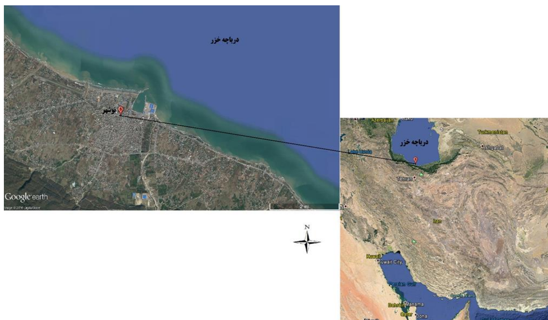
شکل ۱: تصویر ساحل نوشهر در جنوب دریاچه خزر

از سرد شدن، محلول با استفاده از آب دو بار تقطیر در بطری‌های پلی اتیلنی ۵۰ میلی‌لیتری به حجم ۲۵ میلی‌لیتر رسانده شد. سپس نمونه‌ها با استفاده از فیلتر نیتروسولوزی ۰/۴۵ میکرومتر فیلتر شدند. برای اندازه‌گیری میزان فلزات سرب، کادمیوم، روی و مس در تمامی نمونه‌ها از دستگاه جذب اتمی مدل (Varian 220) ساخت کشور استرالیا به روش کوره گرافیتی استفاده شد. حد تشخیص برای فلزات سرب، کادمیوم، روی و مس به ترتیب ۰/۲، ۰/۰۱، ۰/۷۵ و ۰/۳ میکروگرم بر کیلوگرم و میانگین ریکاوری به ترتیب ۹۷/۶، ۹۸/۵، ۹۵ و ۹۸/۶ درصد بود. غلظت این فلزات در بافت‌های ماهیان مورد مطالعه برحسب میلی‌گرم بر کیلوگرم وزن تر ارائه شده‌اند.