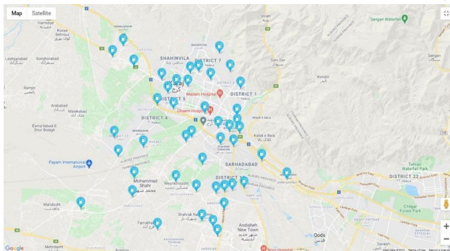
شکل ۱: جایگاه‌های توزیع سوخت تک منظوره شهر کرج

مطالعه حاضر از نوع توصیفی و مقطعی بوده و به منظور تعیین مقادیر غلظتی ترکیبات BTEX و PAHs و پارامترهای موثر بر آن در سال ۱۴۰۰ در بازه زمانی سه ماهه زمستان در ۵ جایگاه توزیع سوخت شهر کرج انجام پذیرفت. کرج بعنوان یکی از کلانشهرهای کشور دارای بیش از ۵۰ جایگاه سوخت بنزین می‌باشد که این رقم قابل توجه می‌تواند بعنوان یکی از منابع اصلی انتشار ترکیبات BTEX و PAHs باشد. در این مطالعه، با استفاده از نرم افزار باک که توسط شرکت ملی