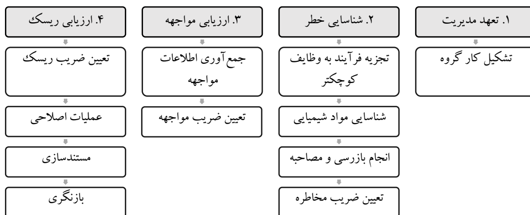
شکل ۱: مراحل ارزیابی ریسک مواد شیمیایی