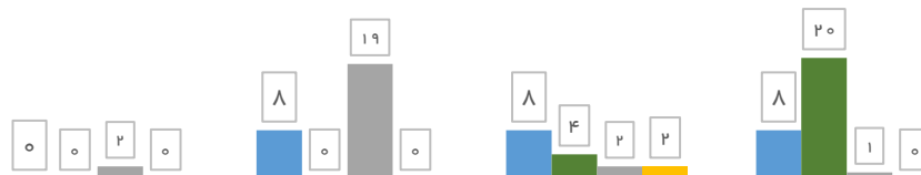
نمودار ۱: توزیع فراوانی ریسک‌های بهداشتی غیر شیمیایی به تفکیک اولویت اقدام